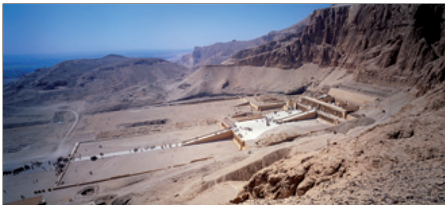
Świątynia królowej Hatszepsut w Deir el-Bahari

isie wykonane zostały na stosunkowo dużych płaszczyznach skał wapiennych o żółtobrązowej, a w niektórych miejscach znacznie ciemniejszej patynie. Część przedstawień wykonana została narzędziem o szerszym ostrzu, ryt innych jest znacznie cieńszy i głębszy. Jeden z rytów jest odosobniony i znajduje się