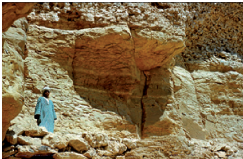
Nawis skalny u podnóża wzniesienia el-Kurn w Masywie Tebańskim

w części schroniska położonej na zachód od dużej szczeliny skalnej. Pozostałe przedstawienia stanowią rodzaj fryzu umieszczonego na powierzchni skał na wysokości sięgającej maksymalnie wzrostu człowieka (licząc od poziomu półki skalnej). Niektóre rytę zachodzą na siebie, przecinają się, niektóre tworzą większe zespoły o wspólnych cechach stylistycznych. Większość rytów jest dobrze zachowanych, nieliczne tylko stanowią fragmenty sylwetek zwierzęcych. Na powierzchni skały znajdują się również rytę niestanowiące sprecyzowanych przedstawień, na przykład poziomo ułożone zygzaki oraz linie pionowe lub ukośne itp. W sumie zarejestrowano