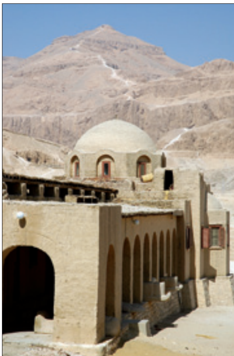
Deir el-Bahari. Wzniesienie el-Kurn