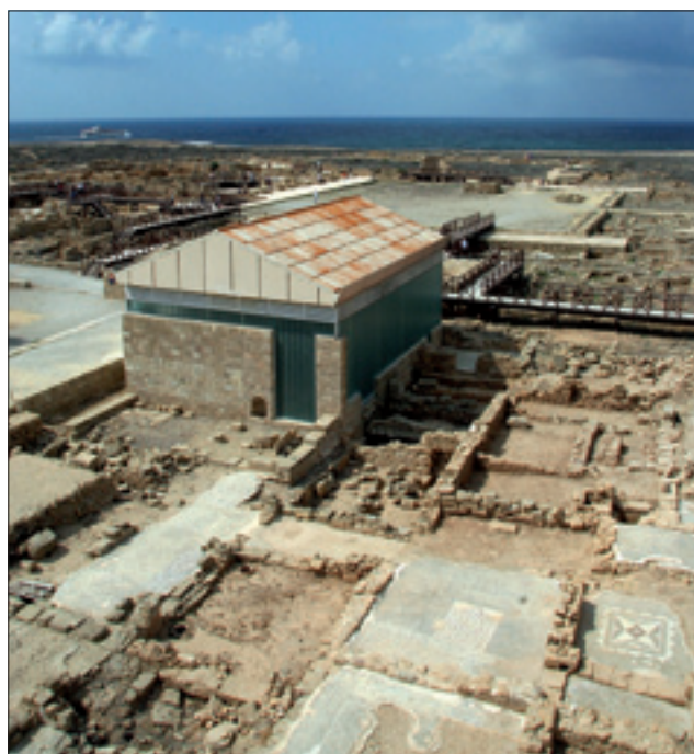
Rzymski Dom Aiona