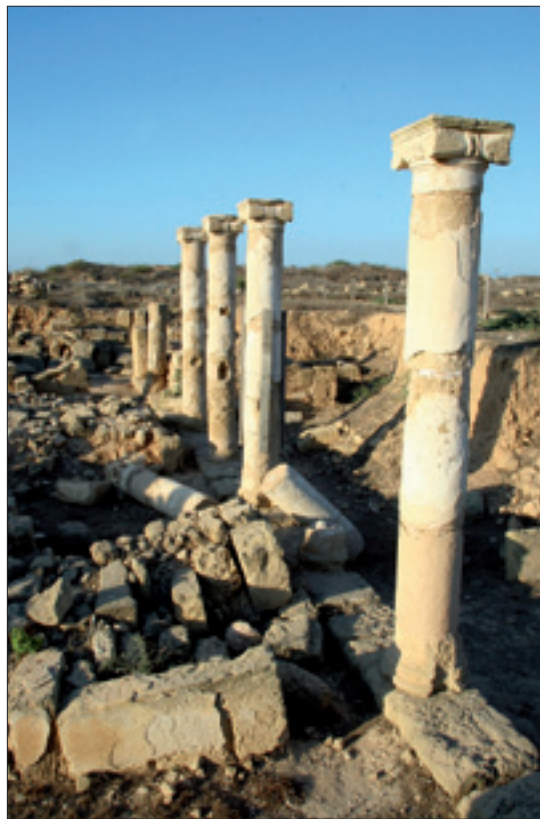
Kolumny dziedzińca Domu Późnhellenistycznego

Miasto było więc znaczącym centrum politycznym i gospodarczym, a o jego rozległych kontaktach świadczą m.in. pozostałości architektury z okresu hellenistycznego, choć niestety zostały one najczęściej zniszczone przez trzęsienia ziemi i późniejsze przebudowy lub zasłonięte powstającymi na ich ruinach budowlami rzymskimi. Jednak Polskiej Misji udało się odsłonić wielki budynek, którego czas powstania można datować na późny okres hellenistyczny (konkretnie koniec II w. p.n.e.). Budynek ten, określany terminem roboczym Dom Późnhellenistyczny, funkcjonował przez około 250 lat, a prace badawcze, mające na celu jego pełne odsłonięcie i przebadanie, trwają nadal. Z okresu hellenistycznego pochodzą też najrozmaitsze zabytki, jak lampki oliwne, terakoty, naczynia szklane, ciężarki tkackie, zabytki brązowe, żelazne i kościane, a także monety. Te ostatnie, bite w Pafos, pochodzą z mennicy królewskiej istniejącej w mieście, a ślady jej działalności w postaci form odlewniczych i nie w pełni