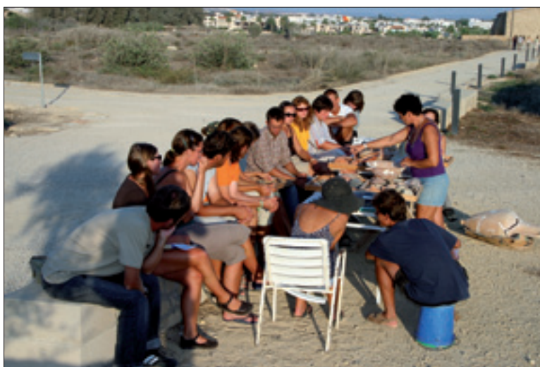
Popołudniowy wykład prezentujący bogactwo ceramiki hellenistycznej, 2006 r.

Każda kampania wykopaliskowa przynosi nowe odkrycia