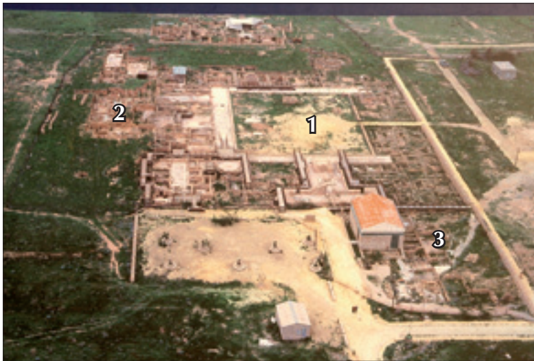
Nea Pafos – ogólny widok wykopisk Polskiej Misji Archeologicznej: 1. Willa Tezeusza, 2. Dom Późnohellenistyczny, 3. Dom Aiona

nazwy poszczególnych okresów rozwoju kultury na wyspie w tej epoce: mówimy o okresie cypro-geometrycznym, cypro-archaicznym czy cypro-klasycznym. Na wyspie istniały w tym czasie królestwa, takie jak Amathus, Kition czy Palepafos (Stara Pafos, dziś jest to wieś Kuklia) i inne. W tym ostatnim czczono Afro-