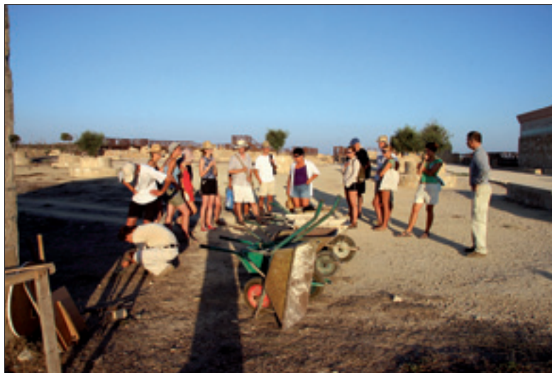
Ekipa przed rozpoczęciem kolejnego dnia wykopisk, 2006 r.