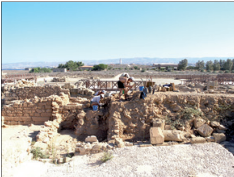
Prace wykopaliskowe w Domu Późnhellenistycznym, 2006 r.

W I wieku p.n.e. Cypr dostaje się pod panowanie rzymskie, ale Nea Pafos nie traci swego znaczenia i nie przestaje być stolicą