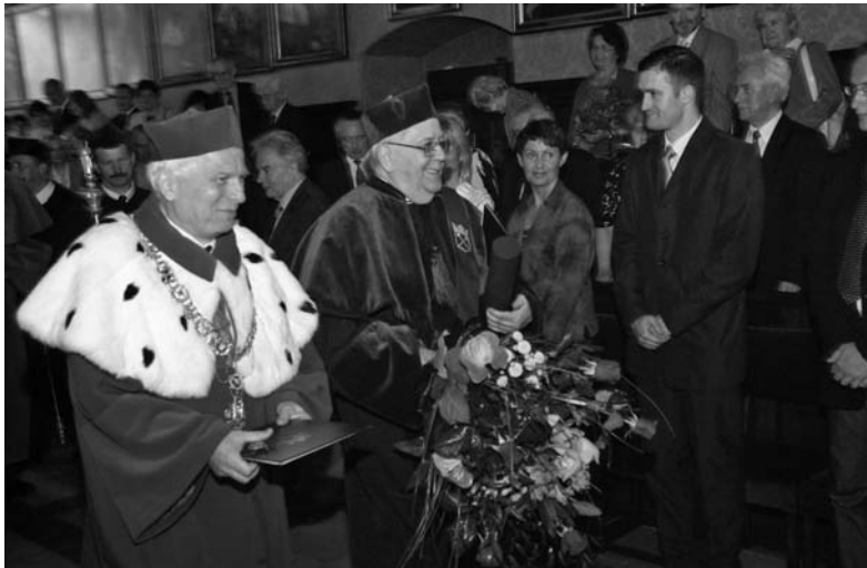
Pierwsze życzenia i gratulacje honorowy profesor UJ odbierał w Auli Collegium Maius