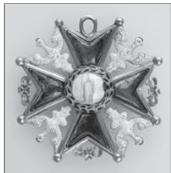
Krzyż Orderu św. Stanisława (awers). Zakup ze środków BPH SA z roku 2006

Poczesne miejsce zajmie przekazany w 2000 roku ostatni dar śp. prof. Karoliny Lanckorońskiej: niezwykle cenne włoskie obrazy z przełomu XIV i XV stulecia, gemma zwana gemmą Lanckorońskiego – jeden z najznakomitszych przykładów ikonografii chrześcijańskiej pierwszego tysiąclecia, oraz starożytna grecka ceramika. Wysta-