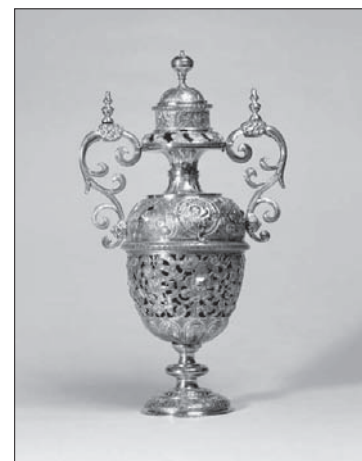
Zegar stolowy, Augsburg, David Fronmler, XVI / XVII w. Zakup w Antykwaracie Connaissance w Warszawie w roku 2003