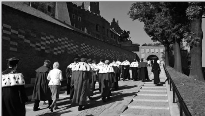
Wejście na Wawel