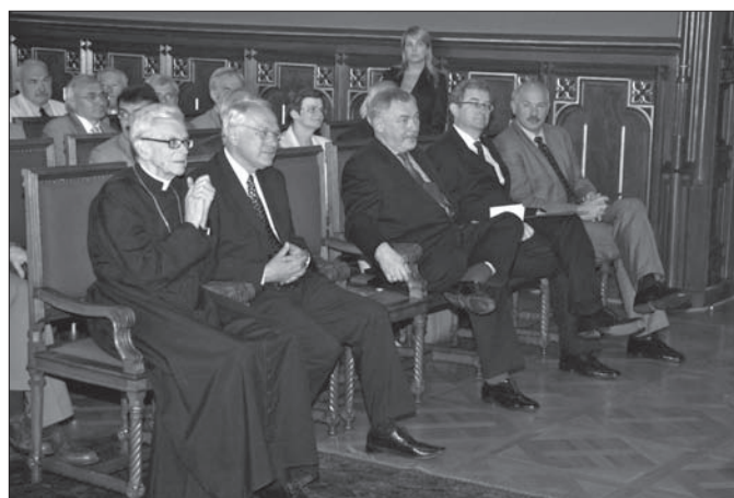
Podczas jubileuszowej sesji w Auli Collegium Novum poruszano przede wszystkim problem autonomii uczelni wyższych