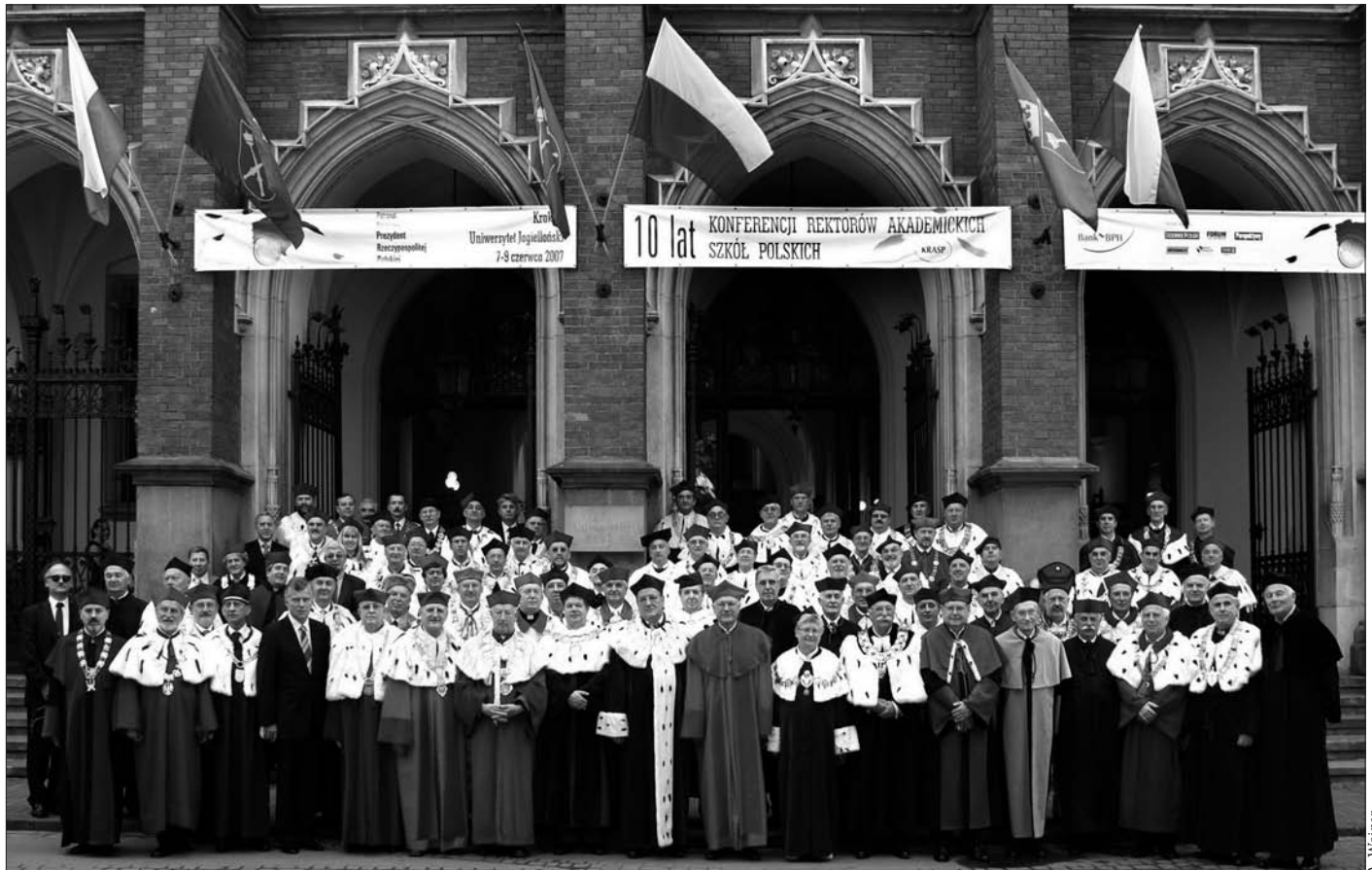
Pamiątkowe zdjęcie rektorów na schodach przed Collegium Novum