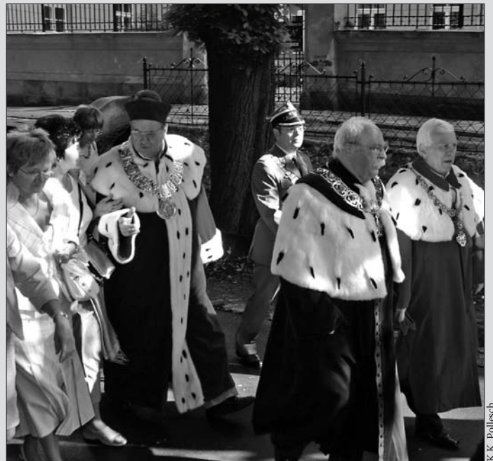
W drodze z Collegium Novum do katedry na Wawelu