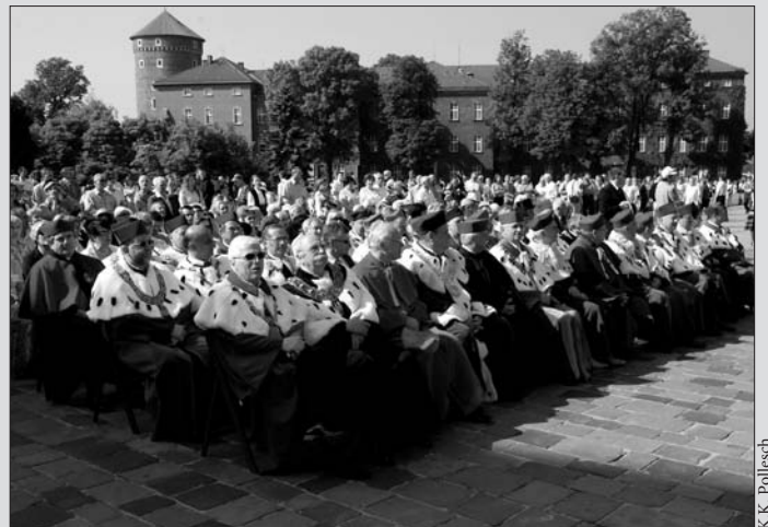
Msza św. na Wzgórzu Wawelskim, 7 czerwca br.