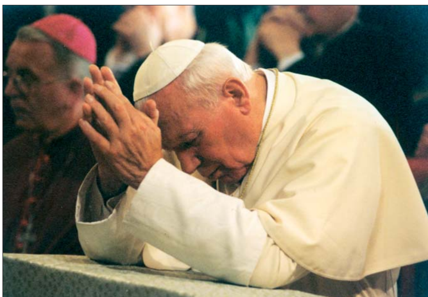
Jasna Góra, kaplica Matki Bożej – modlitwa Jana Pawła II

Kolejną funkcję jasnogórskiego sanktuarium stanowi eklesjalno-twórcze ukierunkowanie maryjności. Znajdowało to wyraz