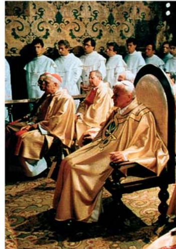
Jan Paweł II na Jasnej Górze (1979, 1983, 1991)