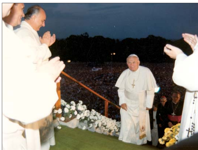
Jasna Góra – przybycie Jana Pawła II na VI Światowy Dzień Młodzieży, sierpień 1991 r.

Więzi Karola Wojtyły – przyszłego papieża Jana Pawła II z Jasną Górą sięgają lat szkolnych: pielgrzymował tutaj z ojcem po śmierci matki, a jako 12-letni chłopiec w 1932 roku z rodzinną parafią z Wadowic w Roku Jubileuszu 550-lecia sanktuarium jasnogórskiego. Pątnicze więzi utrwalał jako student, uczestniczył w akademickiej pielgrzymce 18 maja 1939 roku, a także przybywał konspiracyjnie w czasie drugiej wojny światowej z kolegami (1942, 1943), by kontynuować tradycje ślubowań akademickich, złożonych w 1936 roku na Jasnej Górze. Jako młody duszpasterz akademicki, w cywilnym ubraniu, odbywał ze studentami rowerowe pielgrzymki z Krakowa szlakiem