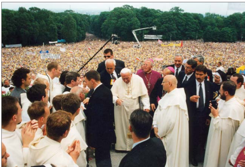
Jan Paweł II na Jasnej Górze (1999)

Dziedzictwo Jasnogórskiego Aktu Oddania Maryi w Niewolę Miłości za Wolność Kościoła w świecie i w Polsce z 1966 roku określił Jan Paweł II jako maryjną polską drogę nowej ewangelizacji, nawiązując do pogłębionej refleksji nad nim i jego aktualnością. Wartość tego Aktu, przejrzystego chrystocentrycznego – jak mówi Następca św. Piotra – wynika także z wielkich owoców, jakie wydał program duszpasterski z nim związany, w połączeniu z peregrynacją Jasnogórskiego Obrazu, i to w okresie wielkiego