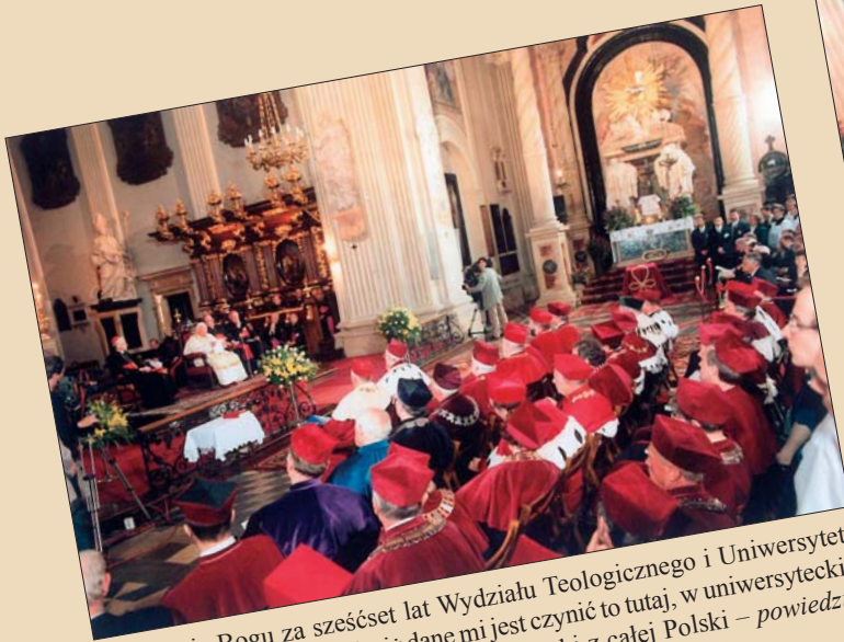
– Dziękuję Bogu za sześćset lat Wydziału Teologicznego i Uniwersytetu Jagiellońskiego. Raduję się, iż dane mi jest czynić to tutaj, w uniwersyteckiej kolegiacie św. Anny w obecności ludzi nauki z całej Polski – powiedział papież Jan Paweł II w swym przemówieniu 8 czerwca 1997 r.