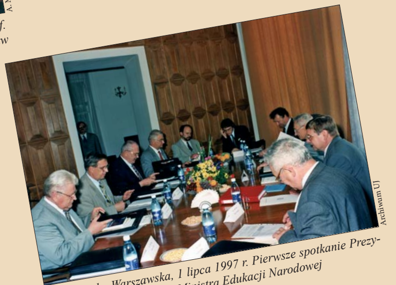
Politechnika Warszawska, 1 lipca 1997 r. Pierwsze spotkanie Prezydium KRASP przy udziale Ministra Edukacji Narodowej