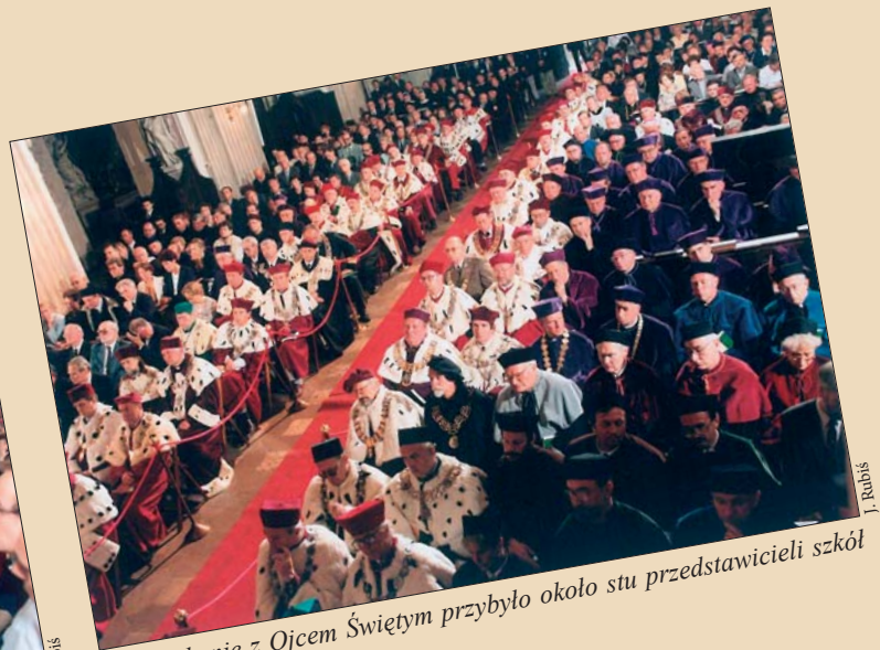
Na spotkanie z Ojcem Świętym przybyło około stu przedstawicieli szkół wyższych z całego kraju