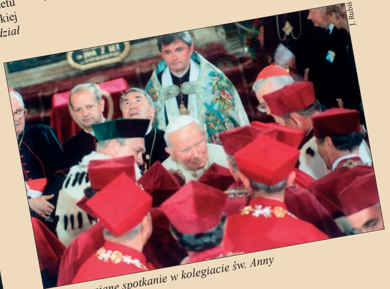
Niezapomniane spotkanie w kolegiacie św. Anny