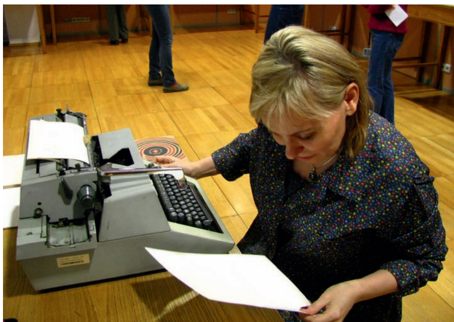
Zwiedzający mogli usiąść przy tradycyjnym biurku bibliotekarza z lat 80.