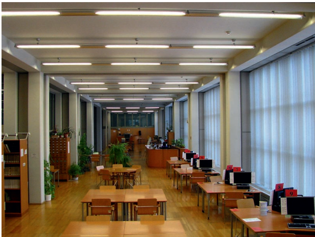
Sala Oddziału Informacji Naukowej i Katalogów w Bibliotece Jagiellońskiej