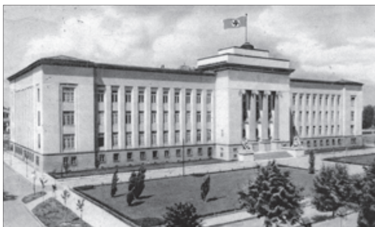
Budynek Akademii Górniczej w Krakowie – siedziba rządu Generalnego Gubernatorstwa The Mining Academy Building, Kraków, used by the Generalgouvernement as headquarters

Bird's-eye view of the Market Square, with St. Adalbert's Church in the centre, 1939–1940