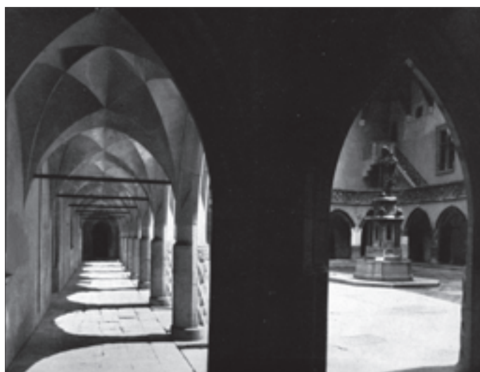
Collegium Maius, siedziba Institut für Deutsche Ostarbeit Collegium Maius, with the Institut für Deutsche Ostarbeit planted in it

Uniwersytetu były jednym wielkim kłamstwem i oszustwem. 31 października 1939 roku Bernhard Rust, niemiecki minister nauki, wychowania i oświaty, pisał do Hansa Franka: Według