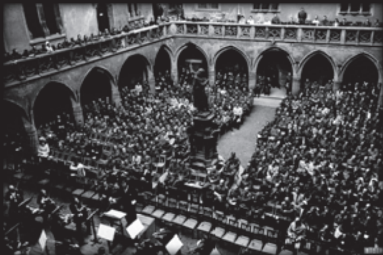
Koncert orkiestry Filharmonii GG na dziedzińcu Collegium Maius, wrzesień 1944 r.

A GG philharmonic concert in the court of Collegium Maius, September 1944