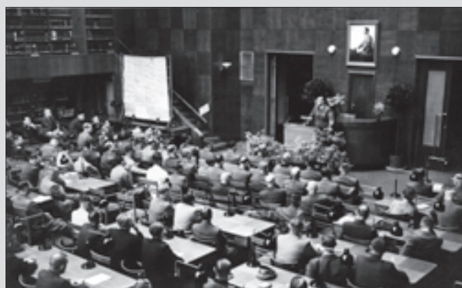
Gubernator Hans Frank przemawia do uczestników kursu na Akademii Administracji Generalnego Gubernatorstwa podczas wykładu w Czytelni Głównej Biblioteki Jagiellońskiej Jagiellonian Library Main Reading Room. Hans Frank addresses participants at a GG Administrative Academy course