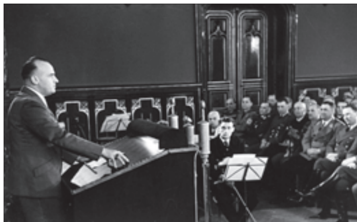
Gubernator Hans Frank przemawia z okazji otwarcia Akademii Administracji w Generalnym Gubernatorstwie Hans Frank's address for the opening of the GG Administrative Academy