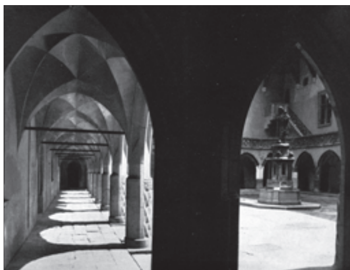
Collegium Maius, siedziba Institut für Deutsche Ostarbeit Collegium Maius, with the Institut für Deutsche Ostarbeit planted in it

Uniwersytetu były jednym wielkim kłamstwem i oszustwem. 31 października 1939 roku Bernhard Rust, niemiecki minister nauki, wychowania i oświaty, pisał do Hansa Franka: Według