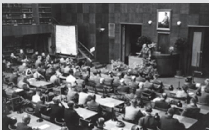
Gubernator Hans Frank przemawia do uczestników kursu na Akademii Administracji Generalnego Gubernatorstwa podczas wykładu w Czytelni Głównej Biblioteki Jagiellońskiej