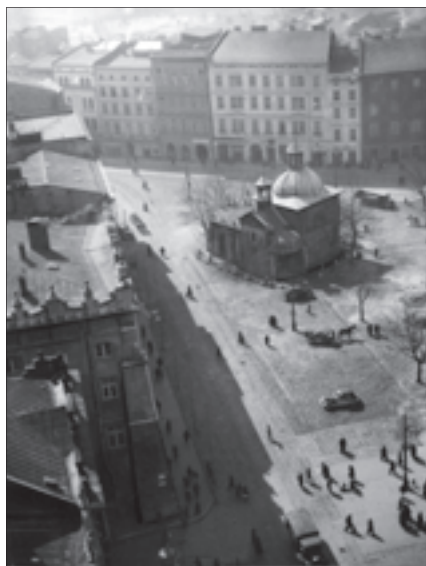
Kraków, Rynek Główny – widok z lotu ptaka. Na środku widoczny kościół św. Wojciecha; lata 1939–1940

2 września Senat UJ wydał odezwę do młodzieży wstępującej do wojska, żegnając ją i życząc jak najrychlejszego powrotu do pracy w murach Uniwersytetu po osiągnięciu zwycięstwa nad wrogiem 8 . Po nieplanowanych dłuższych „wakacjach” do Krakowa powoli powracali profesorowie i asystenci. Zakłady uniwersyteckie funkcjonowały w miarę normalnie, tzn. odbywano posiedzenia naukowe, przygotowywano zweryfikowane plany