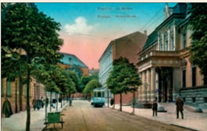
Hotel Francuski w Krakowie przy ul. Pijarskiej wzniesiony w 1912 r.