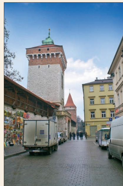
Ul. Pijarska obecnie