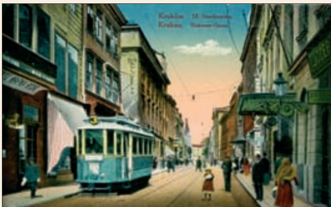
Ulica Szewska na pocztówce z 1916 r. W głębi tramwaj – „czwórka” jadący przez ul. Wolską do wylotu Parku Jordana