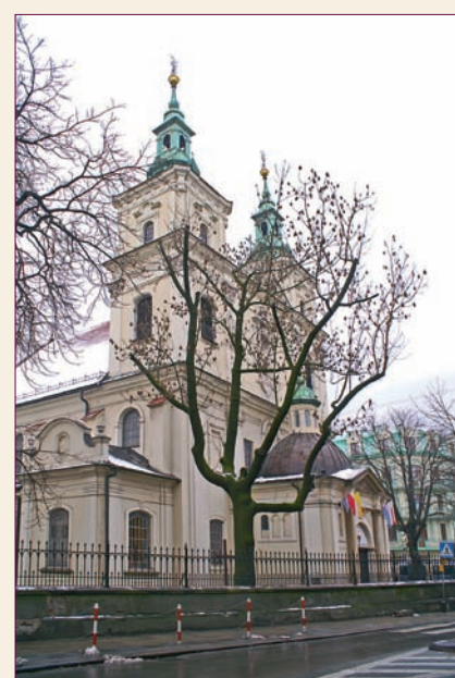
Kościół św. Floriana, dziś