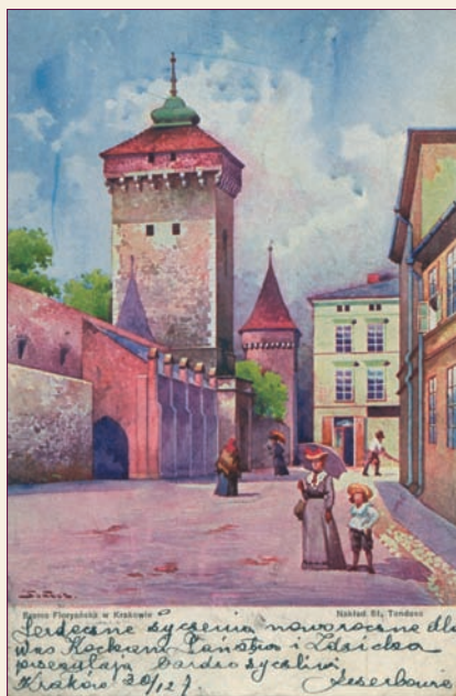
Ul. Pijarska na pocztówce z 1907 r.

Na kolejnej pocztówce widzimy skwer z pomnikiem Tadeusza Rejtana u zbiegu ulic Basztowej, Garbarskiej, Asnyka i Dunajewskiego. Pomnik ten, w niespotykanej w Krakowie formie żeliwnej kapliczki ze spiżowym popiersiem, ustawiono w tym miejscu w 1890 roku. Został