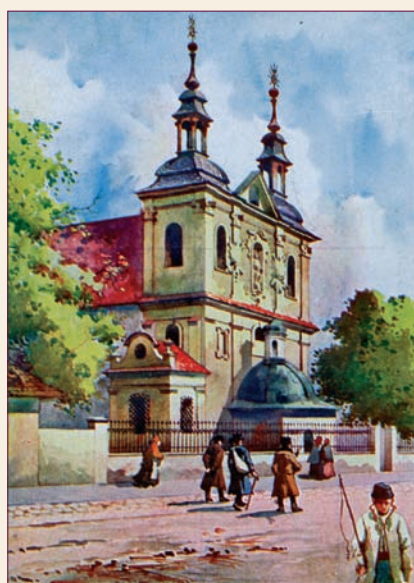
Pocztówka przedstawiająca kościół św. Floriana

zniszczony w roku 1946, a ponownie ustawiono go w tym samym miejscu w roku 2008. Na pocztówce widzimy przed ogrodzeniem otaczającym skwer postacie trzech mężczyzn wizytowo ubranych, w marynarkach, białych koszulach, z kapeluszami na głowach lub w dłoni – jeden z laseczką. Obok stoi dwóch chłopców – jeden w berecie, drugi w kaszkiecie.